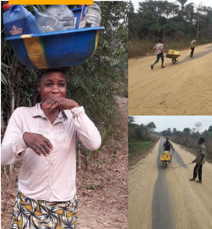
Projet d'approvisionnement en eau potable dans le village de Loukouakoua